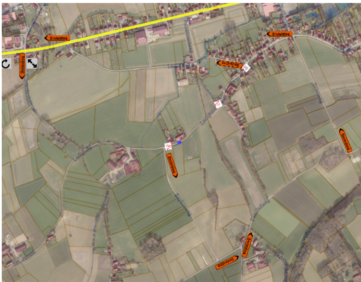
Omlleidingen over Driesweg - Paashofweg - Parkdreef - Baybosweg en Ledigheid - N2 - Stenenkruisstraat -Ledigheidweg