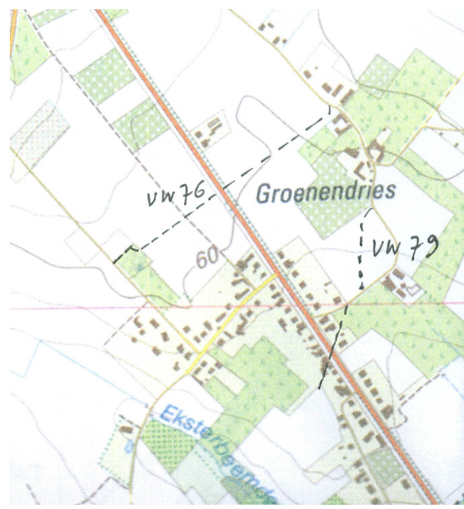
Uittreksel Stafkaart Schaal:1/10.000