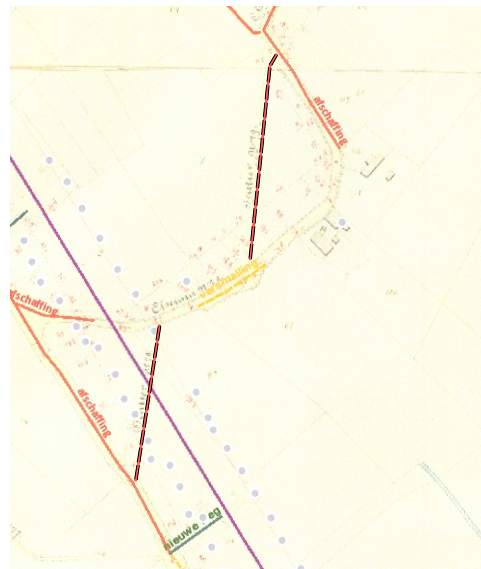
Toekomstige toestand Schaal:1/2500