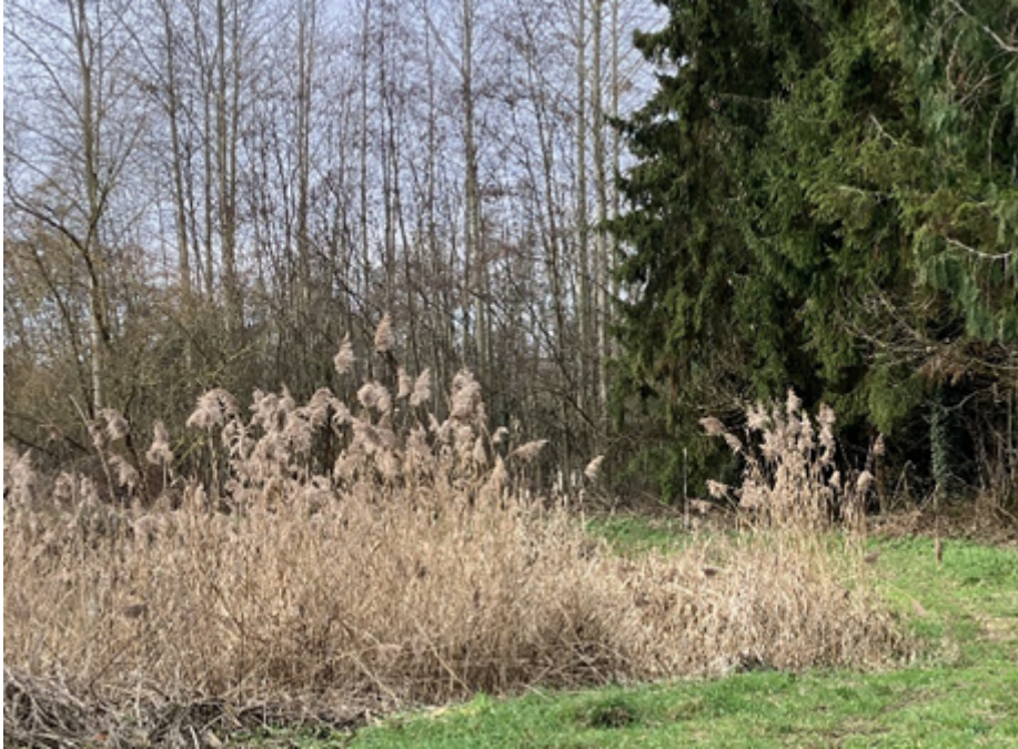
foto vanaf Gellenberg : eenvoudigst lijkt om paadje rechts aan te leggen