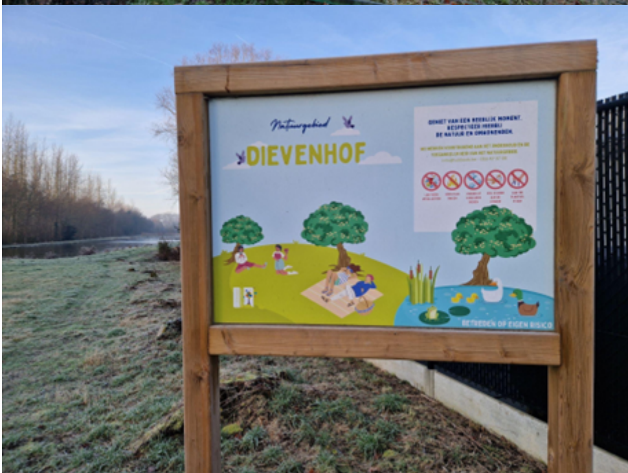
foto's vanaf de kant van Dievenhof