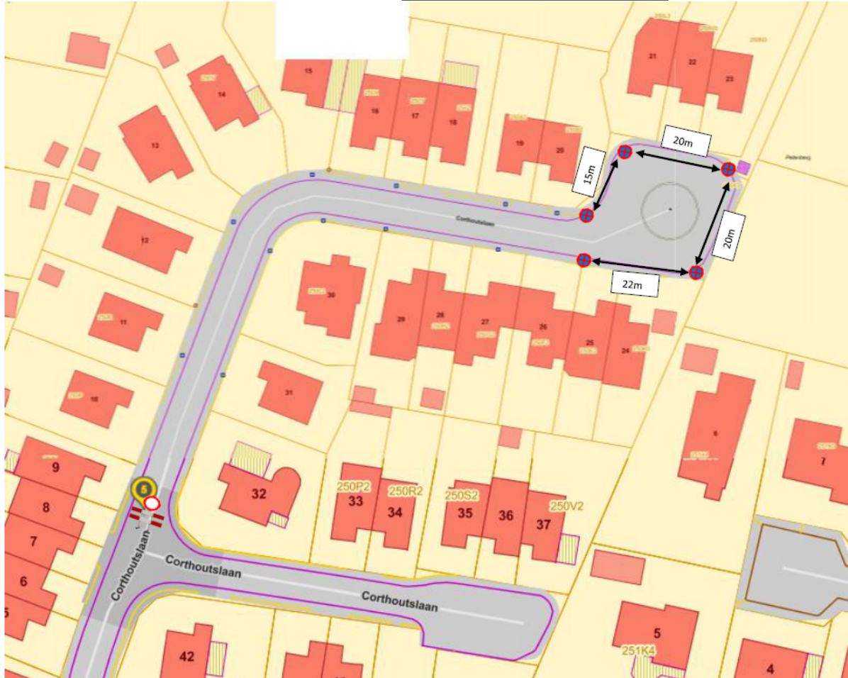
Signalisatieplan – Lubbeek – Corthoutslaan